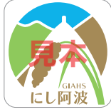
世界農業遺産 にし阿波の傾斜地農耕システム ブランド認証品)ロゴマーク

世界農業遺産にし阿波の傾斜地農耕システムブランド認証品に貼られている(または会計時に渡される)「世界農業遺産にし阿波の傾斜地農耕システムブランド認証品」ロゴマークを3枚集めて、本チラシに付随の専用ハガキ、または市販のハガキに貼付け、郵便番号・住所・氏名・年齢・郵便番号をご記入の上、世界農業遺産「にし阿波の傾斜地農耕システム」ブランド認証品プレゼントキャンペーン事務局までお送りください。